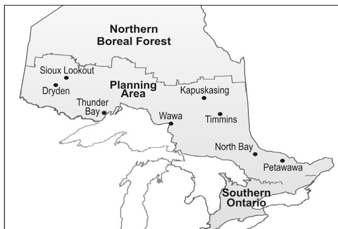
Figure 1. L'emplacement des ensembles expérimentaux NEBIE en Ontario.